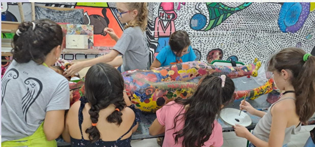
Estudiantes de los talleres infantiles juveniles de la escuela de Artes Visuales, "Prof. Roberto López Carnelli". Actividades realizadas en el marco de la Agenda M 2023