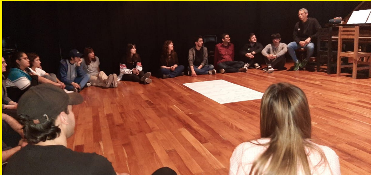
Abordaje transversal de la ESI, Escuela de Música, Danza y Teatro "Prof. Constancio Carminio", 2022